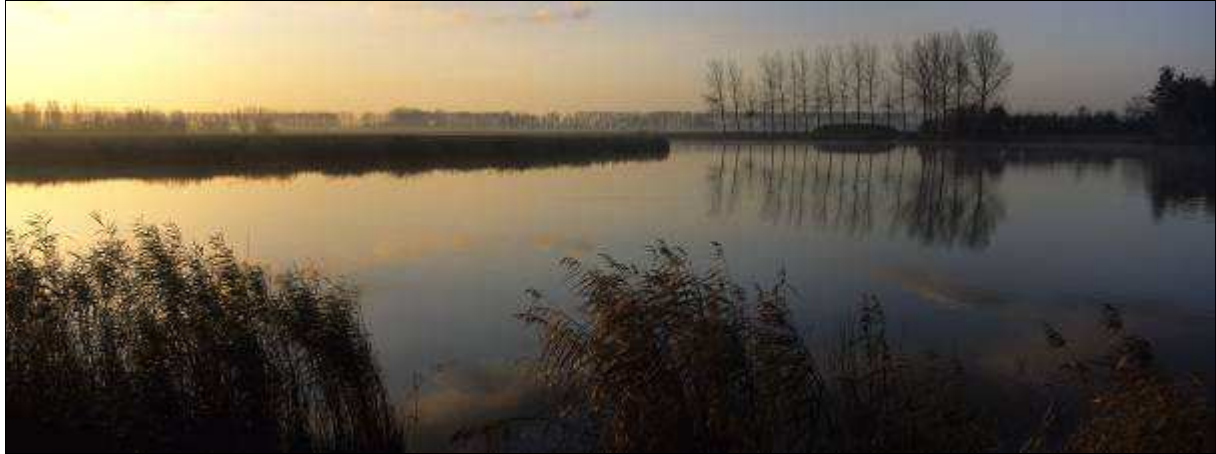
Het krekengebied

In dit hoofdstuk gaan we in op de wezenskenmerken van het Meetjesland, met daaraan gekoppeld de belangrijkste sterkten, zwakten, kansen en bedreigingen.