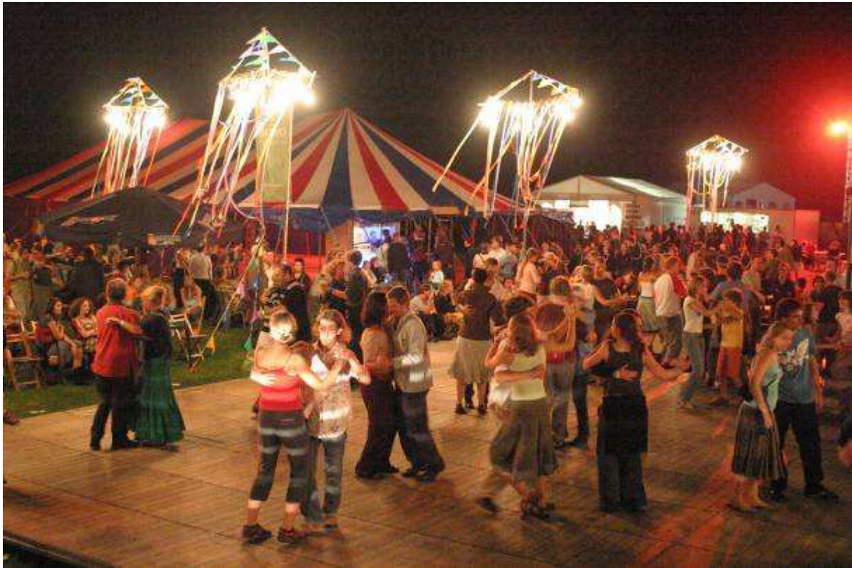
Boombal in Lovendegem

Boven aangehaalde elementen uit de algemene analyse van het Meetjesland (met ligging, cultuurlandschappen, sociaal weefsel, kleinschaligheid en samenwerking als troeven en kansen), vertalen zich tevens naar het beleidsdomein cultuur. In dit hoofdstuk gaan we dan ook dieper in op de wezenskenmerken van het culturele leven in het Meetjesland, met daaraan gekoppeld de belangrijkste sterkten, zwakten, kansen en bedreigingen.